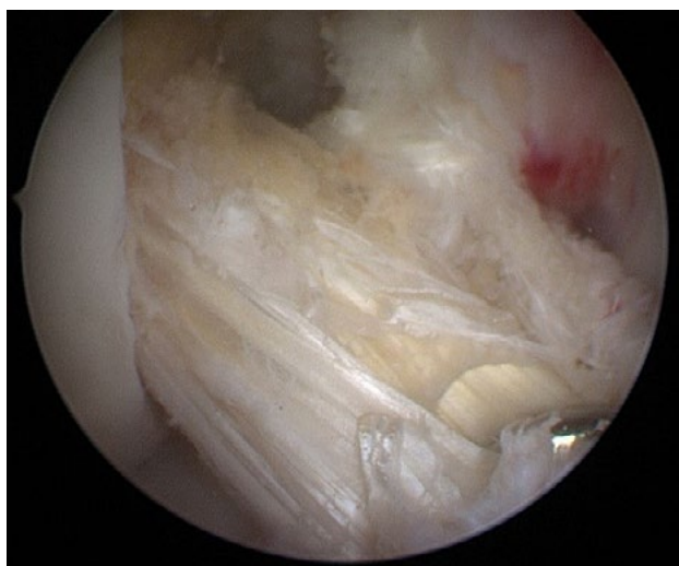
Figura 5: Rodilla derecha. Injerto HTH para la reconstrucción del LCA sin conflicto en la pared ni el techo.

base, 13.5 mm en la zona media y 9 mm en la parte superior para los intercóndilos en forma de A (Tabla 1). No hay diferencias significativas entre la altura de las tres formas, tampoco entre la forma de la escotadura entre ambos sexos, pero sí hay una tendencia a que las mujeres presenten una escotadura femoral más estrecha que los hombres.