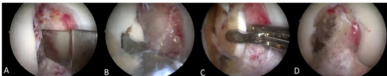
Figura 2: Rodilla derecha. Secuencia de Notchplastia . A) Utilización de escoplo de 10 mm con tope. B) Como primer paso realizamos la remodelación de la pared del intercóndilo lateral con escoplo laminar. C) Retiramos el fragmento con pinza de prensión. D) Remodelación parcial del intercóndilo.