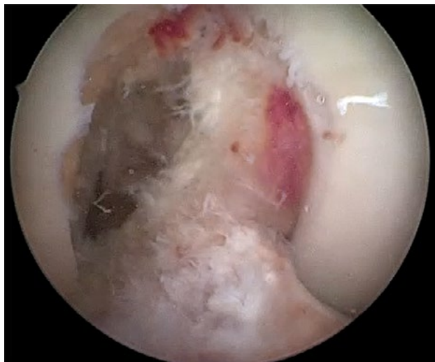
Figura 4: Rodilla derecha. Intercondiloplastia visión final. Forma de U.