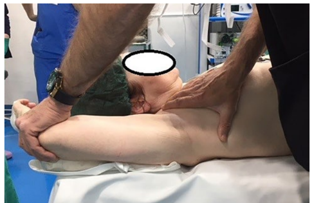
Figura 2: Movilización pasiva de hombro derecho en sesión de fisioterapia postoperatoria.

En el 81.8% se extendió a la cápsula anterior en sentido craneocaudal; en el 63.7% a la cápsula inferior; y en el 36.4% a la cápsula posterior. Se realizó un desbridamiento subacromial en todos los pacientes. En 2 se llevó a cabo la retirada de la placa de osteosíntesis. En los otros 4 con cirugía previa de osteosíntesis se objetivó que el material no producía ningún conflicto mecánico por lo que no se realizó la extracción del mismo (fig. 3). En los 3 casos con cirugía previa de reparación del manguito rotador se comprobó su integridad, por lo que no fue precisa la retirada de hilos de sutura o del implante. El catéter se mantuvo una media 6.3 (3.2) días.