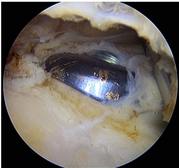
Figura 3: Hombro derecho, visión posterior, espacio subacromial. Placa de osteosíntesis preconformada de húmero próxima en espacio subacromial que no produce conflicto mecánico.